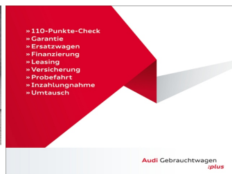
Audi Gebrauchtwagen plus