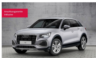
Audi Zentrum Vogtland www.audicar.de